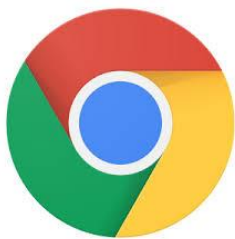
Google Chrome Version 54.0.2840 et ultérieures

Pour accéder au site eHetra, nous vous recommandons d'utiliser l'un des navigateurs suivants :