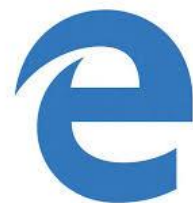
Microsoft Edge Version 38.1439 et ultérieures