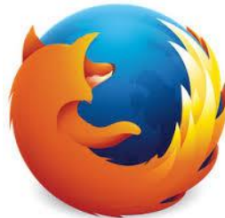
Mozilla Firefox Version 50 et ultérieures